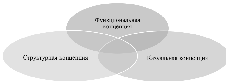
Рис. 1. Концептуальные подходы к сущности социально-экономической системы

Первый подход – функциональный, который рассматривает социально-экономическую систему как функциональную единицу, взаимодействующую с внешней средой, свойства которой обусловлены характером выполняемых функций в исследуемый период времени.