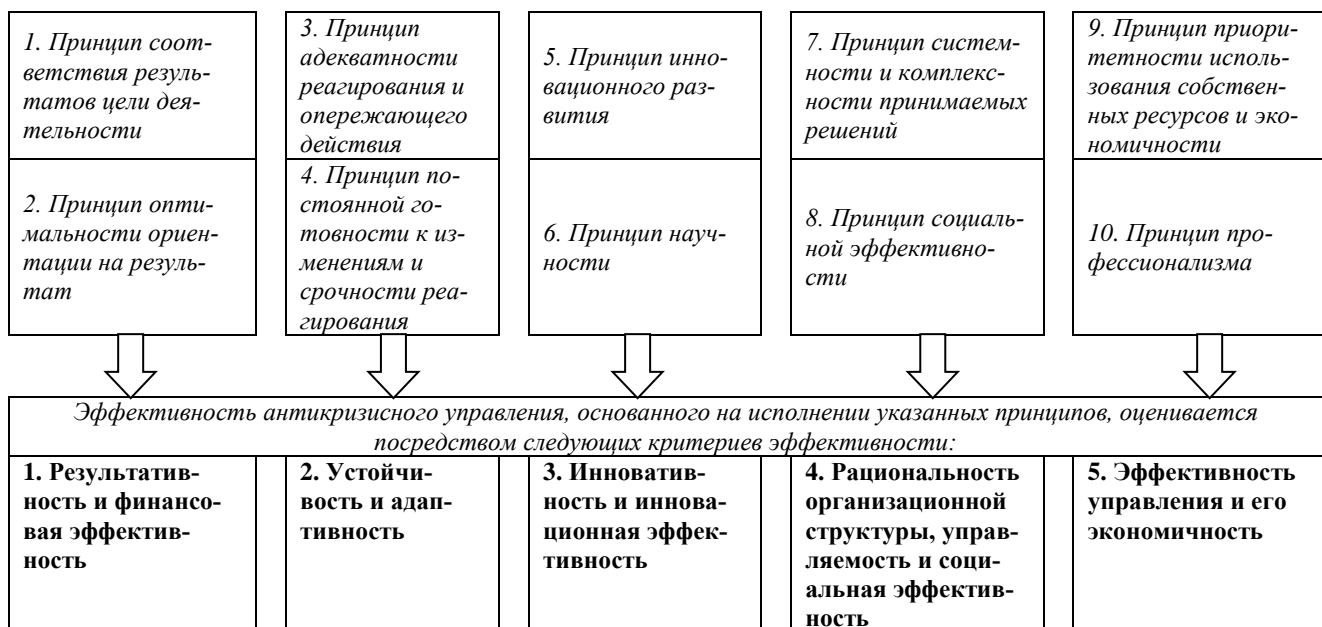
Рис. 1. Взаимосвязь принципов антикризисного управления с критериями оценки эффективности

Оценить эффективность в точных расчетных показателях затруднительно, но ее следует распознавать и учитывать при анализе и оценке управления, его успешности или неудачи [23; 24]. Прежде чем выстраивать методику оценки эффективности антикризисного управления, целесообразно внести некоторые пояснения в использование характеристик эффективности управления. В литературе под категорией «эффективность управления» часто понимается его экономическая эффективность [3], что не совсем верно, так как в случае комплексного подхода к оценке эффективности следует учесть и другие ее составляющие, например адаптивность, управляемость, устойчивость, экономичность и т. д. [9; 17]. Все эти показатели характерны для эффективного антикризисного управления, основанного на рациональных принципах его организации (рис. 1), и будут выступать в качестве критериев эффективности управления.