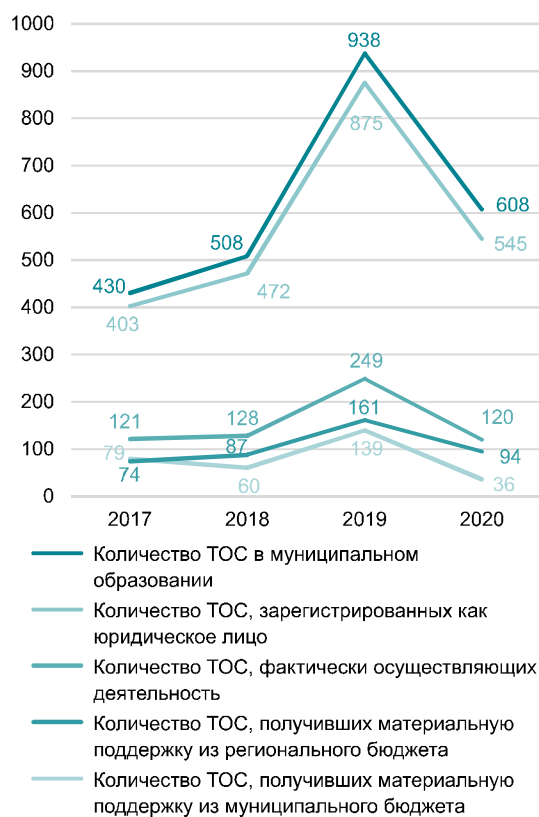
Рис. 1. Показатели количества ТОС, 2017–2020 гг.

Исходя из постановки вопроса в данной работе, считаем целесообразным рассмотреть динамические характеристики ключевых метрик в развитии ТОС на примере Пермского края.