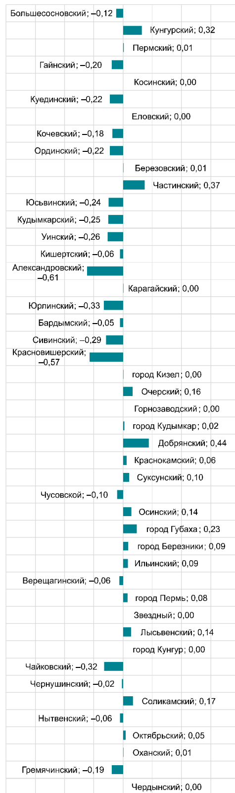
Рис. 5. Среднее значение коэффициента корреляции между показателями ТОС и социально-экономическими показателями в разрезе муниципальных образований, 2017–2020 гг.

В первую группу вошли муниципальные образования с устойчивой отрицательной корреляцией: городские округа – Чайковский, Красновишерский, Кудымкарский; муниципальные округа – Юрлинский, Гайнский, Ординский, Кочевский, Александровский, Уинский, Юсьвинский; Куединский муниципальный район. Нужно подчеркнуть, что большинство муниципальных образований этой группы отличаются низкими темпами социально-экономического развития. Отметим, что в группу попали почти все муниципальные округа Коми-Пермяцкого округа Пермского края. Такую тенденцию следует связывать с территориальными особенностями конкретных муниципальных образований.