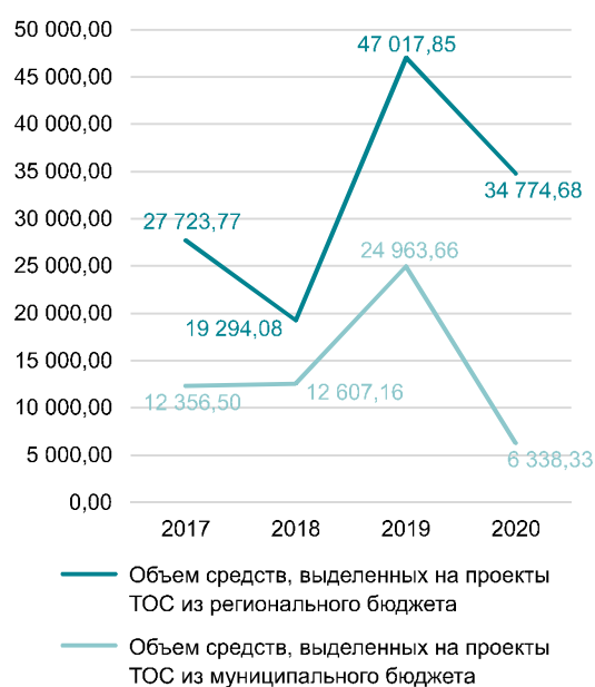
Рис. 2. Финансовые показатели ТОС, 2017–2020 гг.

На рис. 1 показана динамика количества ТОС за 2017–2020 гг., которая является очевидно отрицательной. В то же время отметим всплеск в 2019 г., который можно связать с увеличением бюджетного финансирования ТОС (рис. 2). Но нельзя отрицать и влияние пандемии COVID-19.