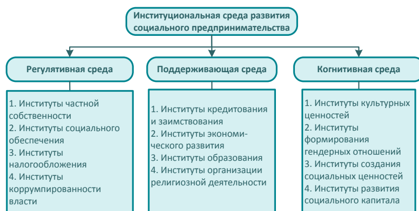
Рис. 2. Институциональная среда развития социального предпринимательства

На рис. 2 представлена институциональная среда развития социального предпринимательства, включающая описанные выше виды институтов.