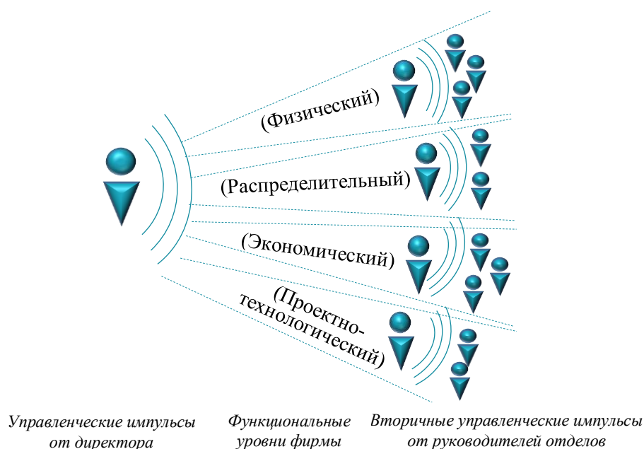
Рис. 1. Поддержание синхронности деятельности функциональных уровней фирмы с помощью импульсного воздействия собственника*

Если указанные импульсы применяются эффективно, то все подразделения действуют синхронно (рис. 1).