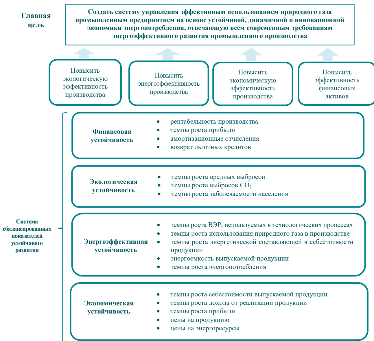
Рис. 1. Стратегическая карта развития энергоэффективности использования природного газа промышленным предприятием